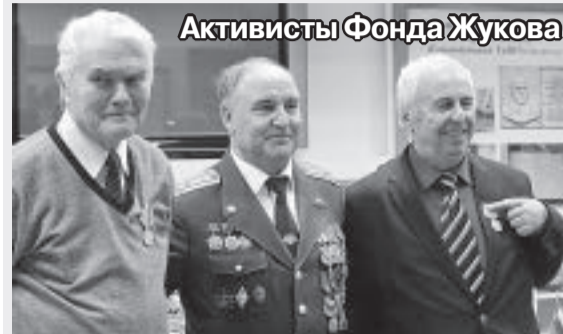
Активисты Фонда Жукова

В начале декабря в календаре по соседству оказались две знаменательные даты: 120-летие со дня рождения Георгия Константиновича Жукова - маршала Победы, и День Героев Отечества.