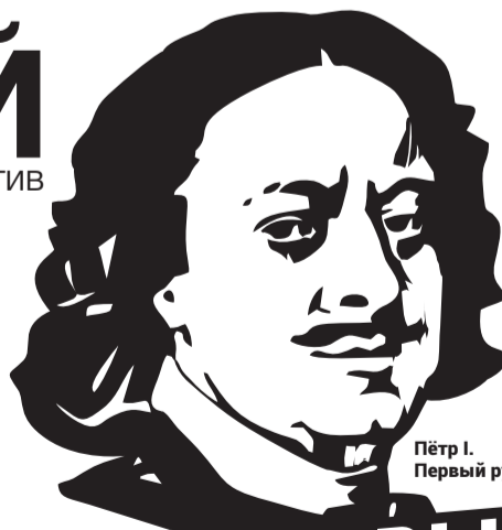
Пётр I. Первый русский император.

*среди финансовых продуктов КПК «Первый».